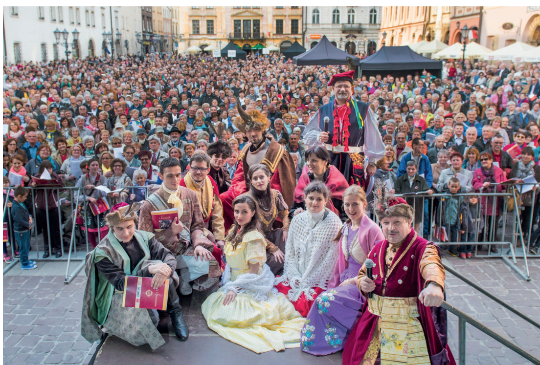
Fotografia z 60. Lekcji Śpiewania, 3 maja 2016 r.

Artystom, Przyjaciołom Biblioteki Polskiej Piosenki, a także ambasadorom Lekcji Śpiewania ofiarnie zaangażowanym w to przedsięwzięcie w kraju i na świecie!!!