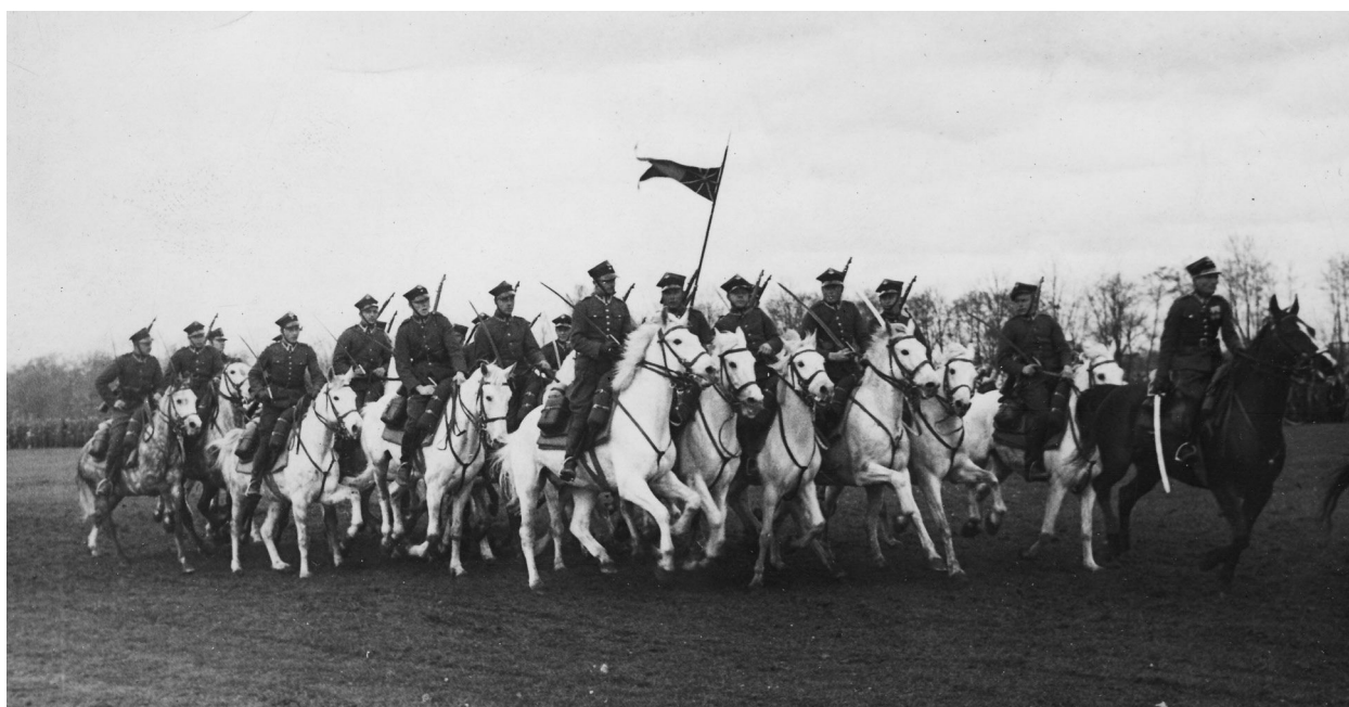
„Obchody rocznicy uchwalenia konstytucji 3 Maja w Krakowie - defilada kawalerii na Błoniach”, 1938 r., fot. Agencja Fotograficzna „Światowid”, arch. Muzeum Historyczne Miasta Krakowa

Panienka wnet wrota otworzyła, Ułanów na nocleg zaprosiła.