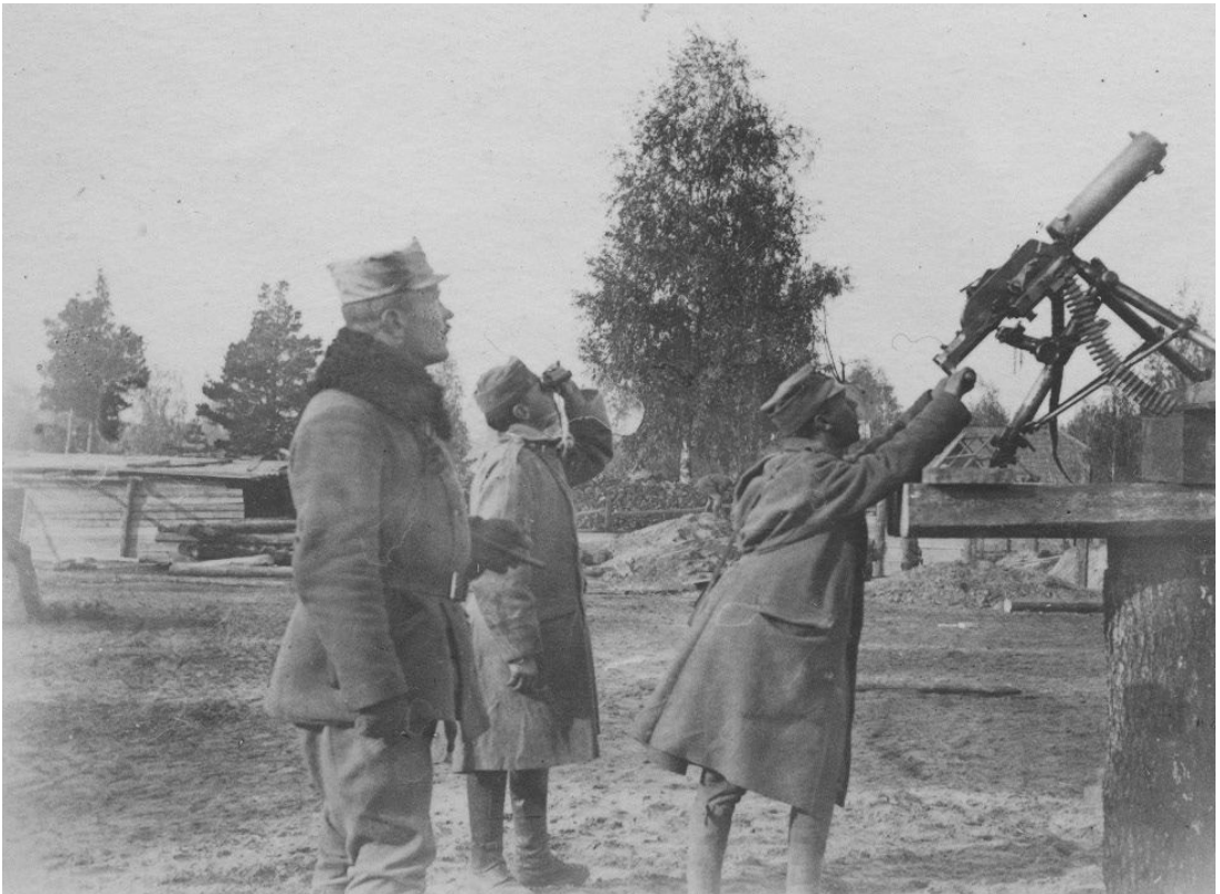
„Ogień przeciwlotniczy, tym razem pozorowany”

Lecą, lecą gwiazdy złote, w ognistym snopie; Klęknij sobie żołnierzyku, klęknij w okopie, I paciorek tobie grzecznie mówią potrzeba. Bo gdzie padną gwiazdki złote, wnet ukoisz ból, tęsknotę; Pójdiesz do nieba, chłopczyku! Pójdiesz do nieba!