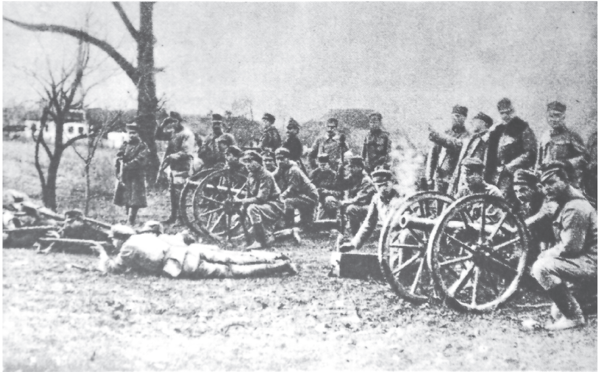
II Brygada Legionów Polskich, 1914., „Ilustrowana kronika Legionów Polskich 1914-18”, Warszawa 1936

Nie gniewajcie się wcale za szczerą moją, Lecz tych dział się Moskale niewiele boją. Choć to przecie u kata Także wreszcie armata! Armata, tra-ta-ta-ta, nasza armata!