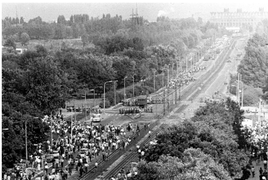
Pochód Solidarności wychodzący z Huty im. Lenina, lato 1982 roku.