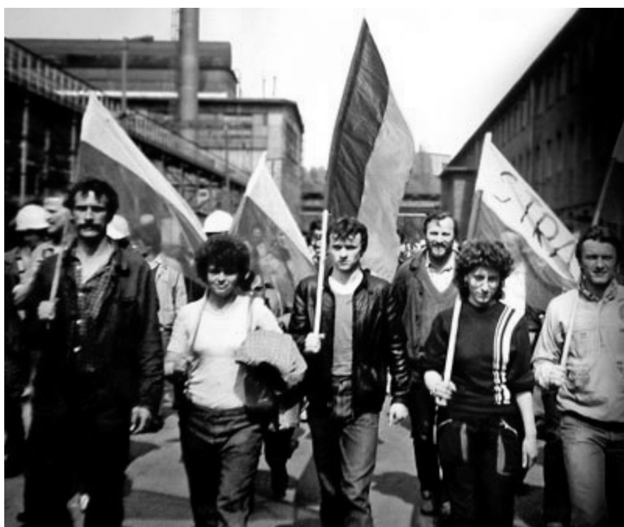
1 maja 1988 roku w Hucie im. Lenina