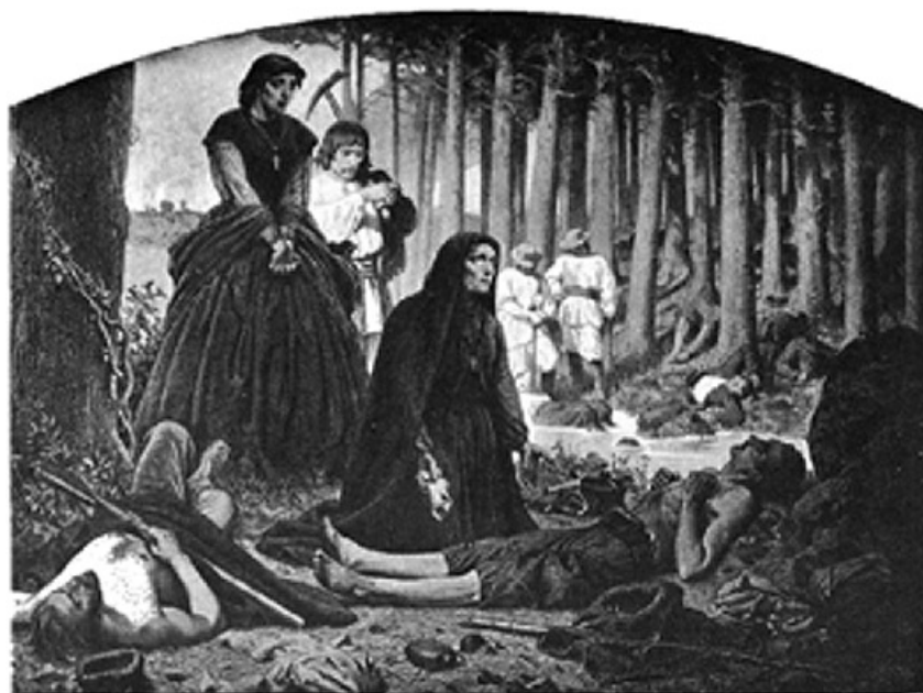
Artur Grottger „Na pobojowisku” z cyklu Polonia, 1866

Zwyciężonemu za pomnik grobowy Zostaną sucha drewna szubienicy, Za całą sławę krótki płacz kobiety I długie nocne rodaków rozmowy.