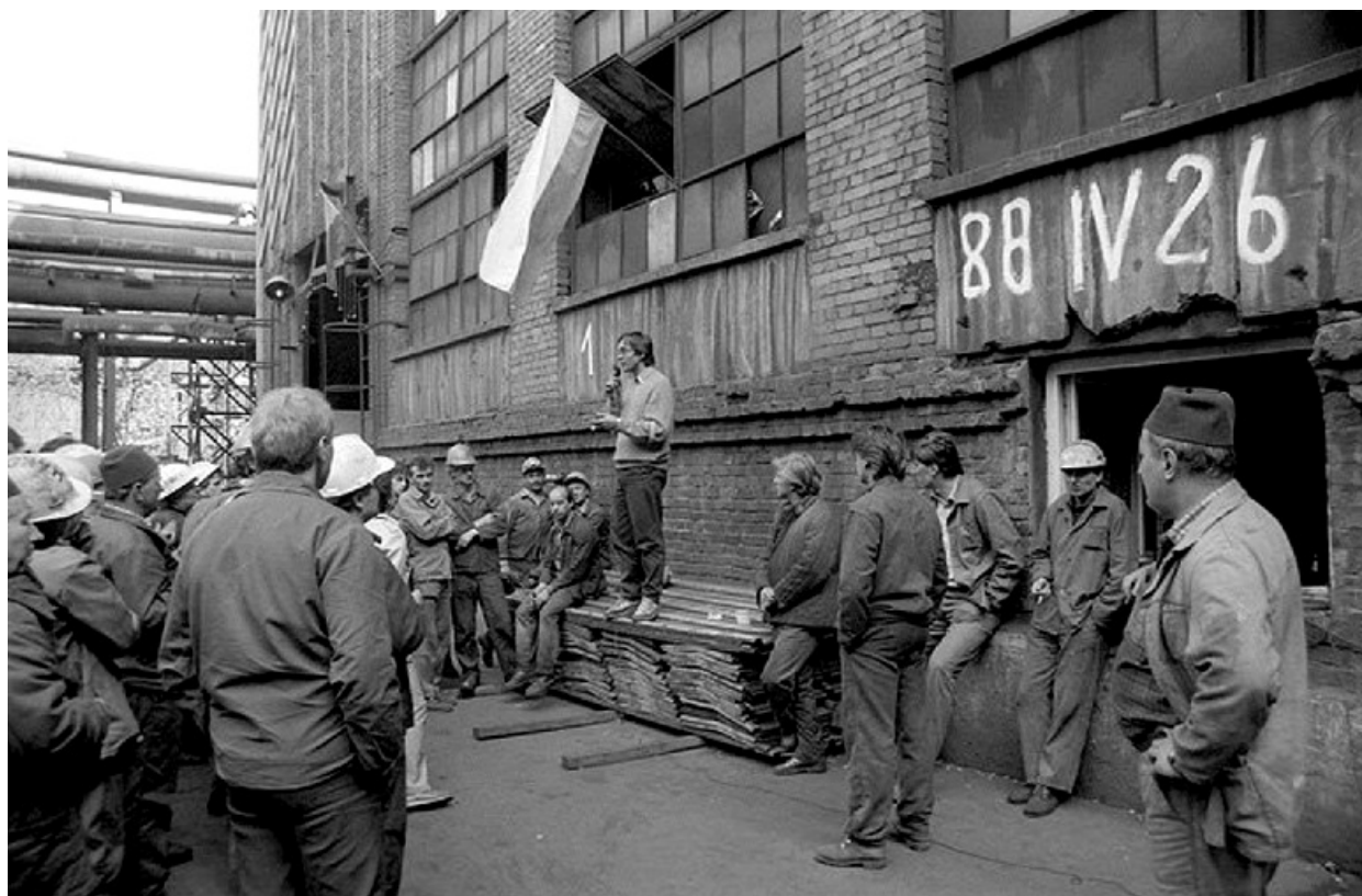
Wiec pod halą zgniatacza Huty im. Lenina, kwiecień 1988 roku.

Przyśpiewka towarzysząca internowanym i skazanym podczas transportów. Powstała w Łupkowie . Słowo „mandżur” oznacza w więziennej gwarze tobolek bagażowy osadzonego.