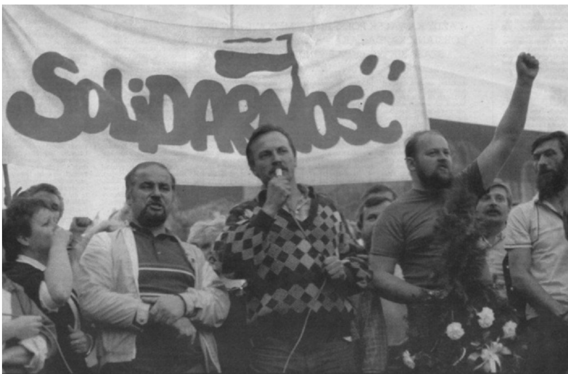
Wiec Solidarności po bramę główną Huty im. Lenina, sierpień 1988 roku.

Jej twórcą był Maciej Zembaty znany satyryk i twórca radiowy, w stanie wojennym internowany w Białolece.