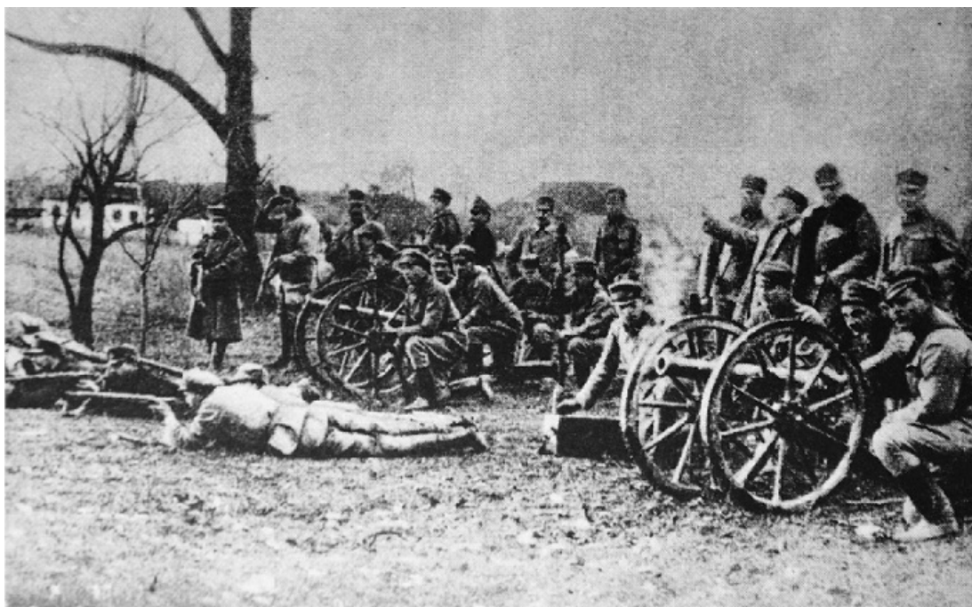
II Brygada Legionów Polskich, 1914. "Ilustrowana kronika Legionów Polskich 1914-18", Warszawa 1936

Nie gniewajcie się wcale za szczerość moją, Lecz tych dział się Moskale niewiele boją. Choć to przecie u kata Także wreszcie armata! Armata, tra-ta-ta-ta, nasza armata!