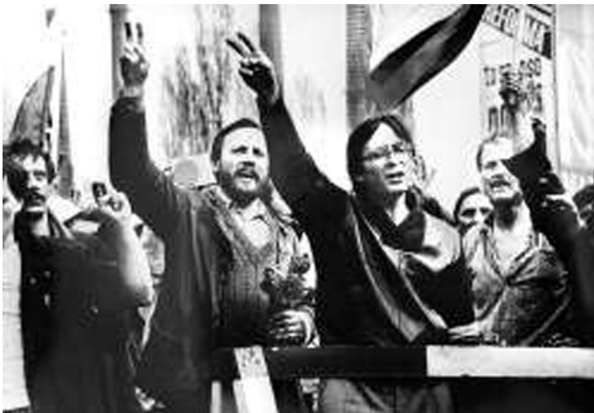
1 maja 1988 roku, pod bramą główną Huty im. Lenina

Solidarni, nasz jest ten dzień, A jutro jest nieznane, Lecz żyjmy tak, jak gdyby nasz był wiek; Pod wolny kraj spokojnie kładź fundament. /A jeśli ktoś nasz polski dom zapali, To każdy z nas gotowy musi być, Bo lepiej byśmy stojąc umierali, Niż mamy klęcząc na kolanach żyć. Solidarni, nasz jest ten dzień; Zjednoczmy się, bo jeden jest nasz cel ! /2x