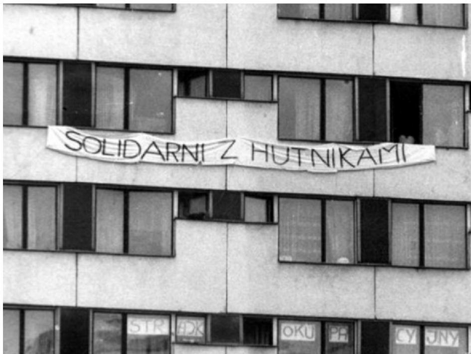
Studenci krakowscy solidarni z hutnikami, kwiecień/maj 1988 roku.

Śpiewana na góralską nutę w internatach i więzieniach Polski południowej. Jej twórcą jest góral z Nowego Targu internowany w Załężu i Łupkowie.