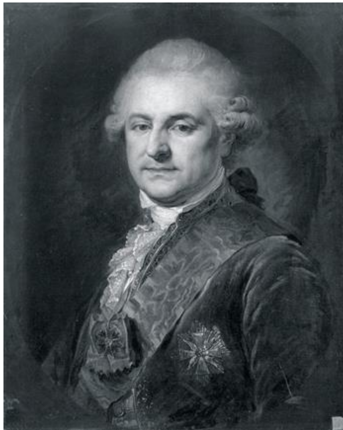
Marcello Bacciarelli, Portret Stanisława Augusta Poniatowskiego

Dłużej was nie chcemy męczyć, więc sięgnijcie po podręcznik!!!